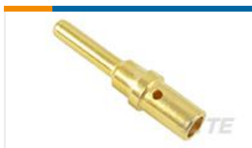
TE 产品编号0460-220-1231 PIN, SOLID, SIZE 12,12-14AWG, AU