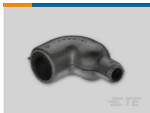
TE 产品编号409670-000 球形热缩护套：有嘴，直角