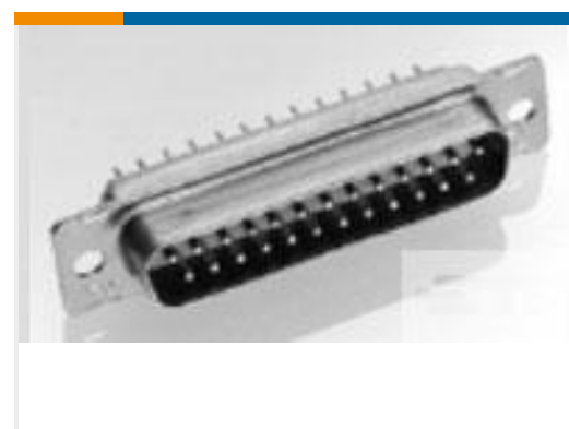
TE 产品编号1218124-1 9 POS, ASSY, PLUG, LOW PROF, 109