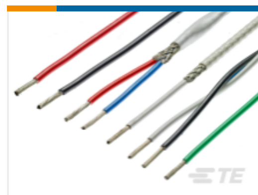
TE 产品编号2832273002 44A0111-20-45