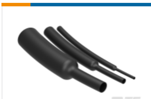
TE 产品编号7989236001 CGPT 2:1 热缩管