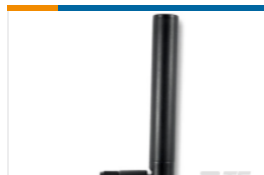
TE 产品编号001-0012 ANTENNA,2.4/5.5 GHz Dipole,IP67