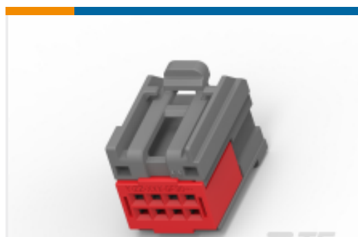
TE 产品编号1411168-1 MARKET2X4FEM.UNSEA