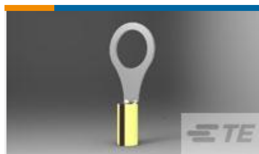
TE 产品编号2-320576-3 TERMINAL,PIDG R IR 10 5/16