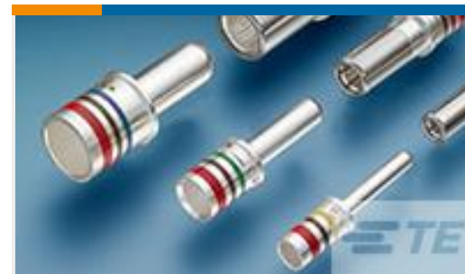
TE 产品编号0660-206-0082 CONT PIN