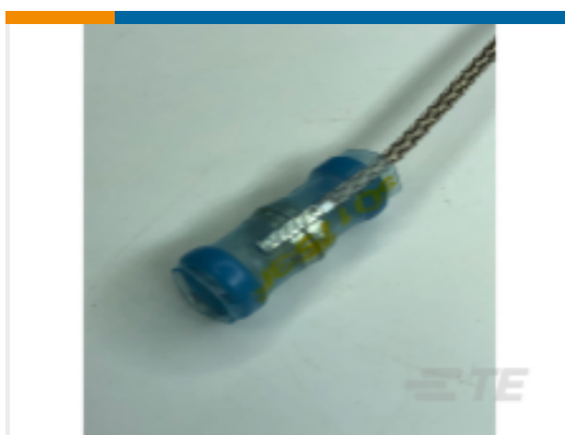
TE 产品编号625415-000 SO63-4-55-24-9