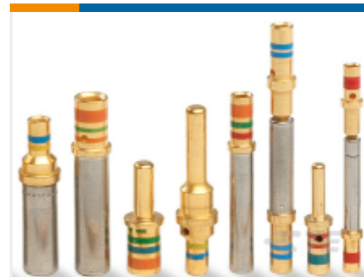
TE 产品编号2560-201-2031L CONT PIN