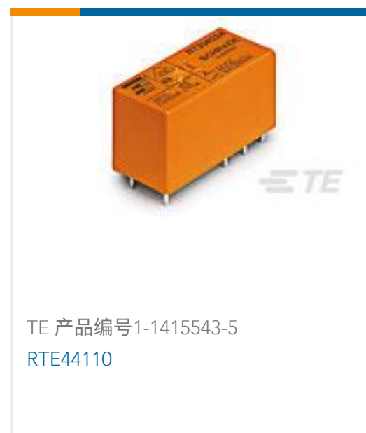
TE 产品编号1-1415543-5 RTE44110