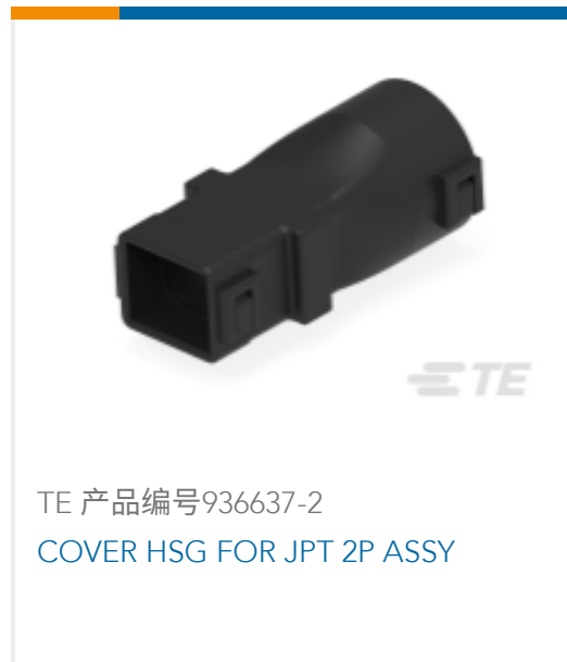
TE 产品编号936637-2 COVER HSG FOR JPT 2P ASSY