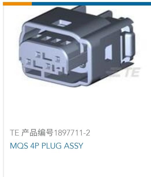
TE 产品编号1897711-2 MQS 4P PLUG ASSY