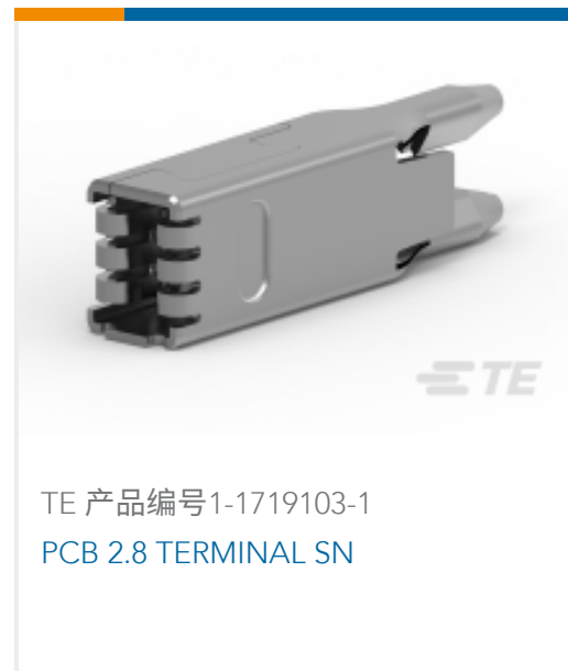
TE 产品编号1-1719103-1 PCB 2.8 TERMINAL SN