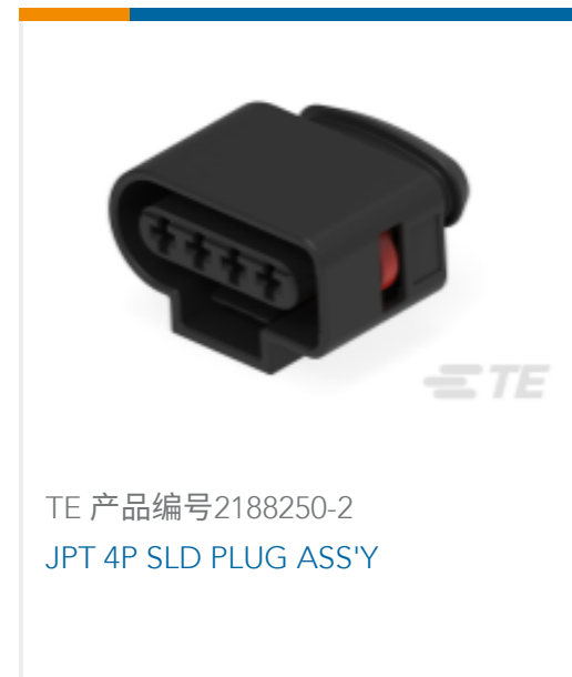
TE 产品编号2188250-2 JPT 4P SLD PLUG ASS'Y