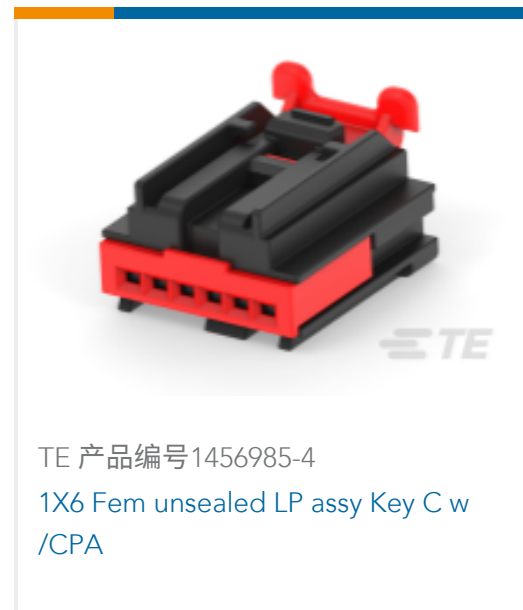
TE 产品编号1456985-4 1X6 Fem unsealed LP assy Key C w /CPA