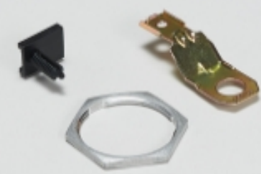
其他汽车连接器附件(4)