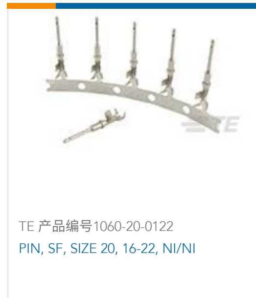
TE 产品编号1060-20-0122 PIN, SF, SIZE 20, 16-22, NI/NI