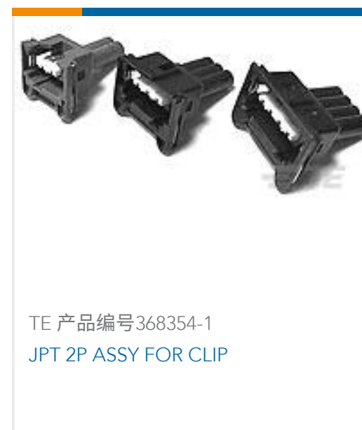
TE 产品编号368354-1 JPT 2P ASSY FOR CLIP