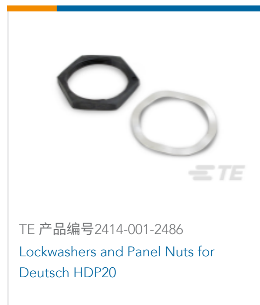
TE 产品编号2414-001-2486 Lockwashers and Panel Nuts for Deutsch HDP20