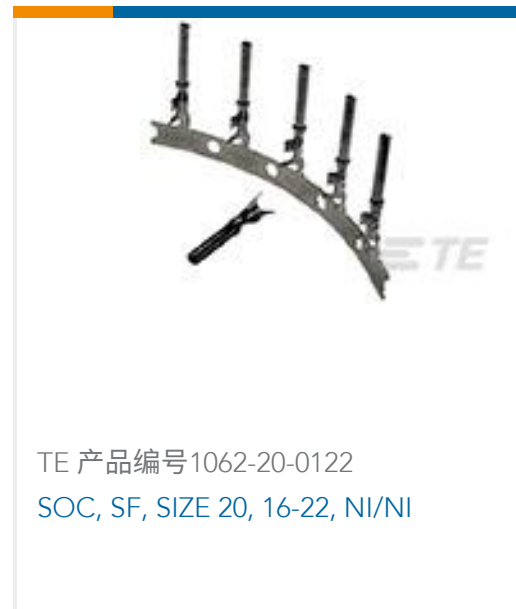
TE 产品编号1062-20-0122 SOC, SF, SIZE 20, 16-22, NI/NI