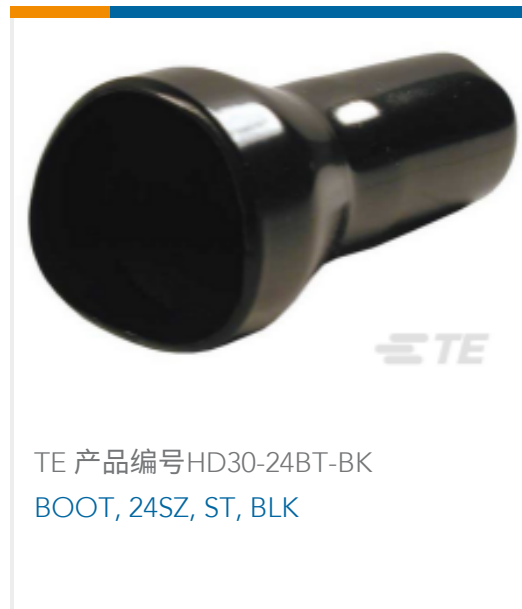
TE 产品编号HD30-24BT-BK BOOT, 24SZ, ST, BLK