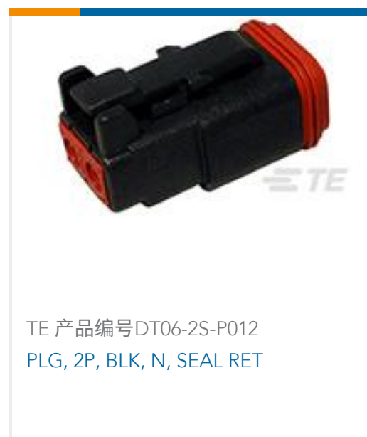
TE 产品编号DT06-2S-P012 PLG, 2P, BLK, N, SEAL RET