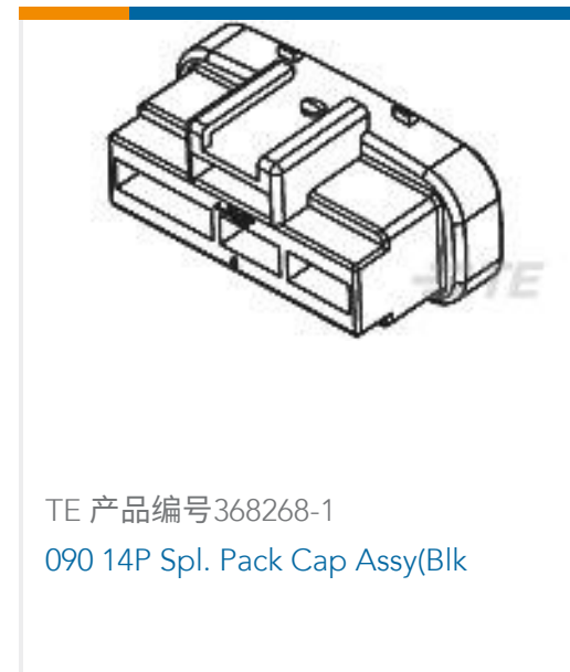
TE 产品编号368268-1 090 14P Spl. Pack Cap Assy(Blk)