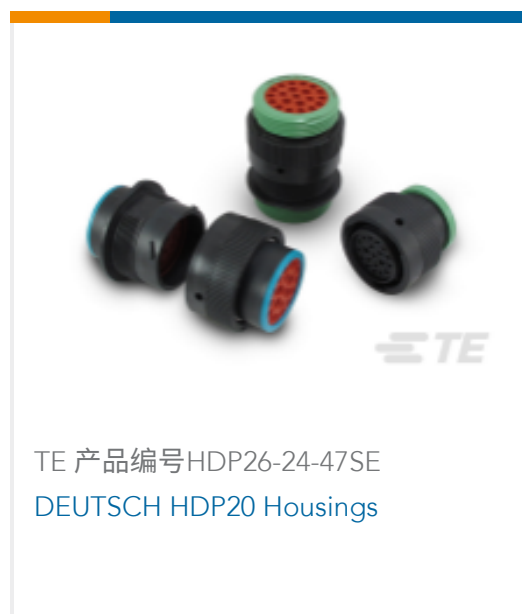
TE 产品编号HDP26-24-47SE DEUTSCH HDP20 Housings