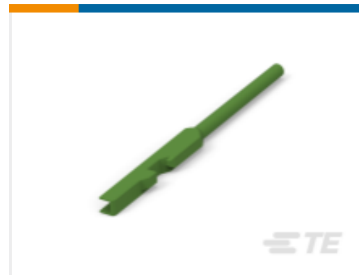
TE 产品编号2286476-2 BLIND PLUG, MCON 1.2 CB