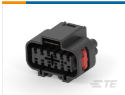
TE 产品编号2297907-1 12 WAY IN-LINE REC PLUG ASSY