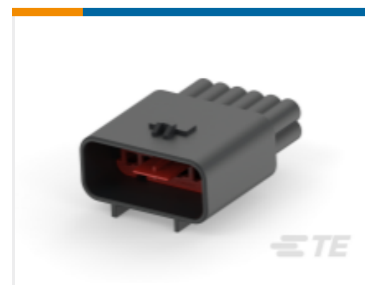
TE 产品编号2297911-1 12 WAY IN-LINE TAB PLUG ASSY