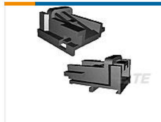
TE 产品编号1534149-1 MQS RETAINER, BLACK