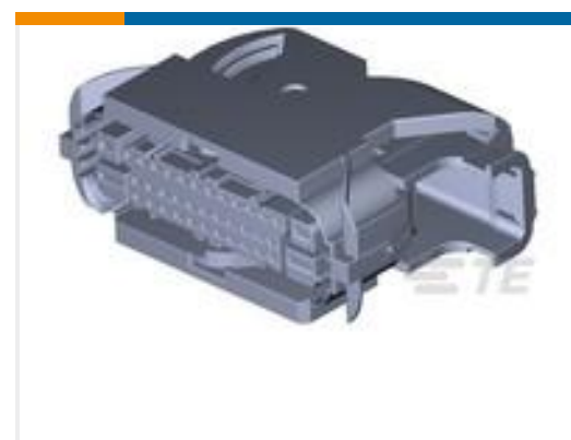
TE 产品编号1-2112502-1 38POS, MIXED, REC HSG, ASSY, SEALED