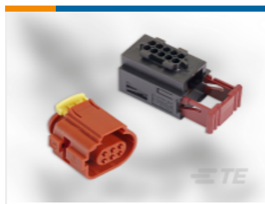
TE 产品编号1897119-4 Timer Connector Housing