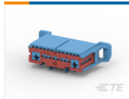
TE 产品编号2295163-3 22POS, MIXED, REC HSG, ASSY