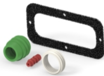
连接器密封件和盲堵(5)