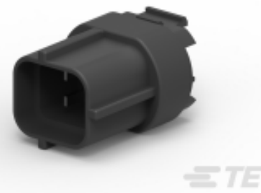
TE 产品编号 936418-2 BACK WARNING SENSOR 4P ASSY