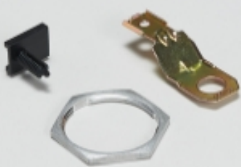
其他汽车连接器附件(4)