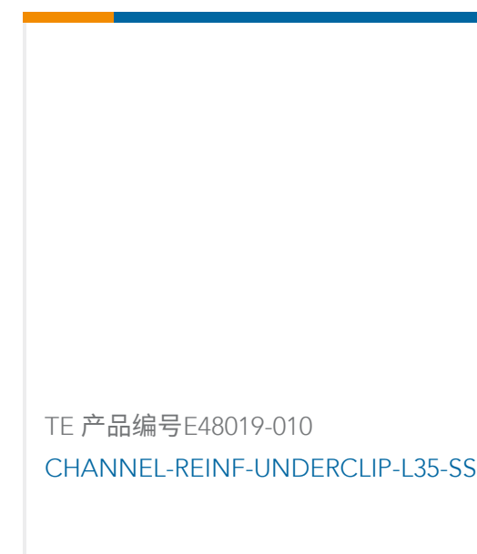
TE 产品编号E48019-010 CHANNEL-REINF-UNDERCLIP-L35-SS