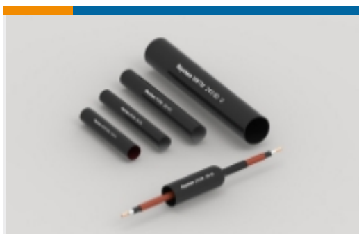
电源电缆管路和附件(299)