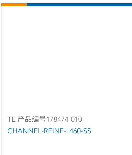
TE 产品编号178474-010 CHANNEL-REINF-L460-SS