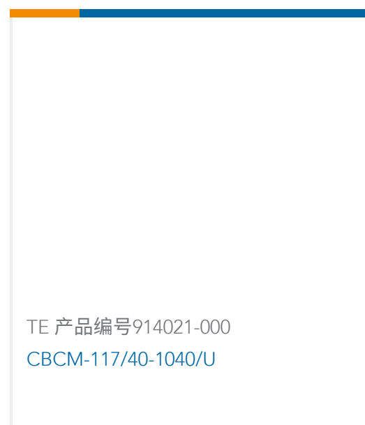
TE 产品编号914021-000 CBCM-117/40-1040/U