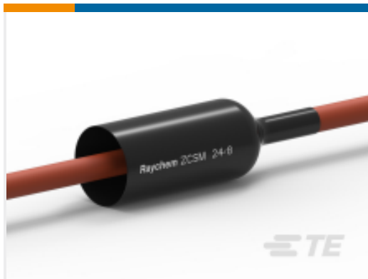
TE 产品编号 F22126-000 ZCSM-24/8-1000/U