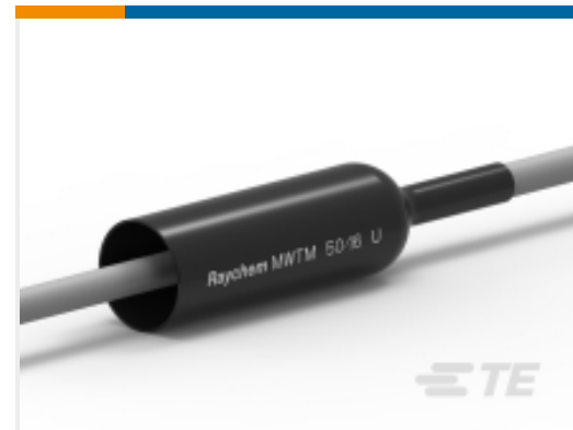
TE 产品编号 CAT-MWTM 中厚壁热缩管