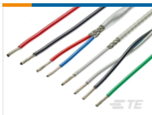
TE 产品编号2611473001 44A0111-12-54