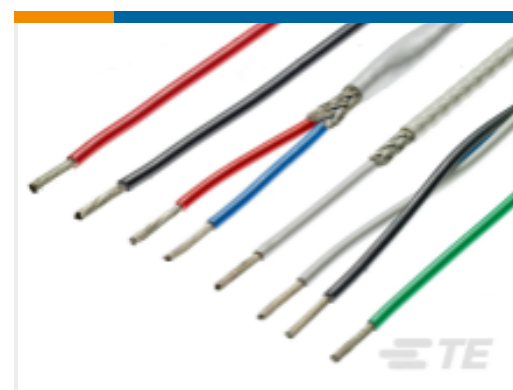
TE 产品编号2823013001 44A0211-8-9