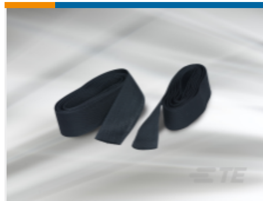
TE 产品编号 7480624003 HFT5000 热缩管