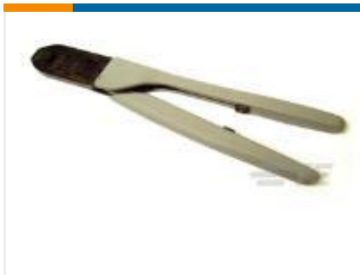
TE 产品编号 91500-1 CCII UNML UNML II PIN SKT 20-14 ASSY