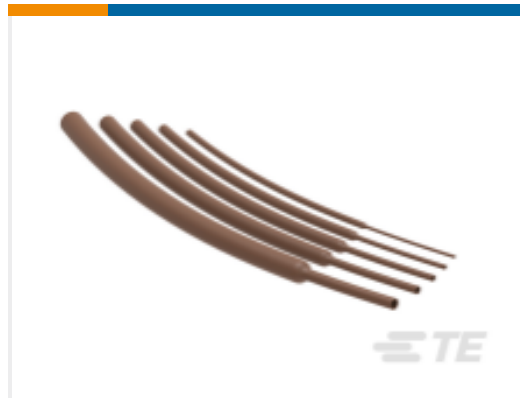
TE 产品编号 5070114020 RNF-100-1 热缩管