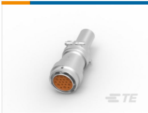
TE 产品编号 HD36-24-19SN-059 PLG,19P,AL,N,CBLCLMP BT,DRAIN,12 /16,S,MC