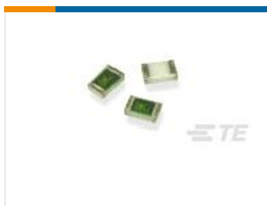
TE 产品编号 6-1879127-7 RN 0402 422R 0.1% 10PPM CUT LENGTH