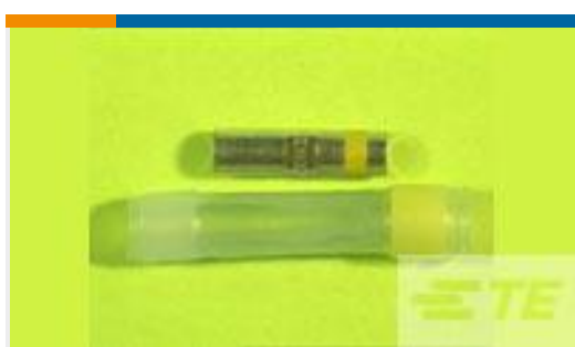
TE 产品编号 650075-000 D-436-37