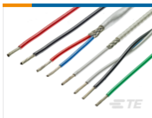
TE 产品编号 2611473001 44A0111-12-54