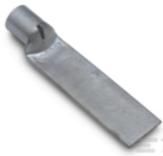
TE 产品编号2-326111-1 AMPOWER Terminal Without Stud Hole