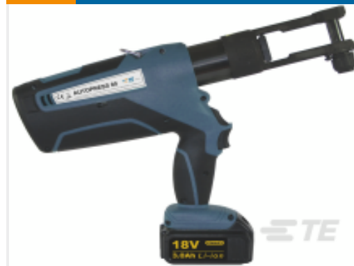
TE 产品编号 2107730-1 AutoPress 80 18V+COF+CHARG