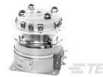
TE 产品编号6-1393139-3 MDR-5061=MDR