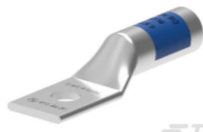
TE 产品编号EN3750-775 TCTS-3/0-1/2-U