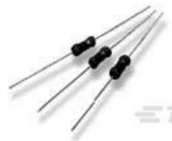
TE 产品编号3-1879351-7 RR01 5% 91K AMMO