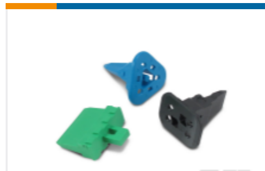
TE 产品编号W2S Wedgelocks: DEUTSCH DT