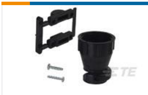
TE 产品编号206070-8 CABLE CLAMP KIT #17