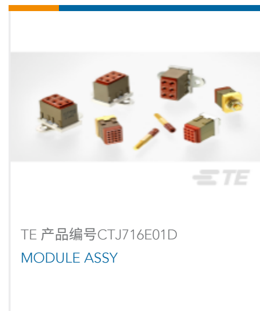
TE 产品编号CTJ716E01D MODULE ASSY