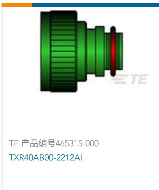
TE 产品编号465315-000 TXR40AB00-2212AI