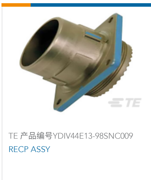
TE 产品编号YDIV44E13-98SNC009 RECP ASSY