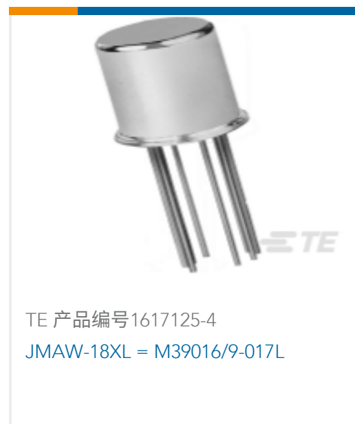
TE 产品编号1617125-4 JMAW-18XL = M39016/9-017L