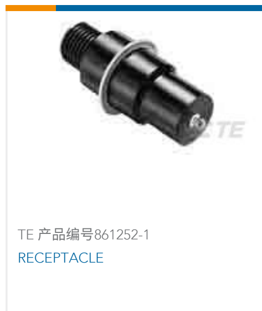
TE 产品编号861252-1 RECEPTACLE