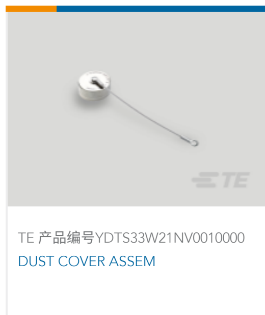
TE 产品编号YDTS33W21NV0010000 DUST COVER ASSEM