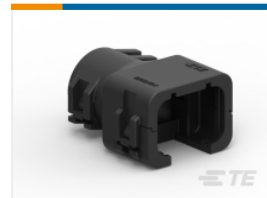
TE 产品编号2292799-3 AS16 BACKSHELL, 4P PLUG, NC12, MC