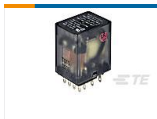
TE 产品编号4-1393122-3 KHAU-17D11-12=KH