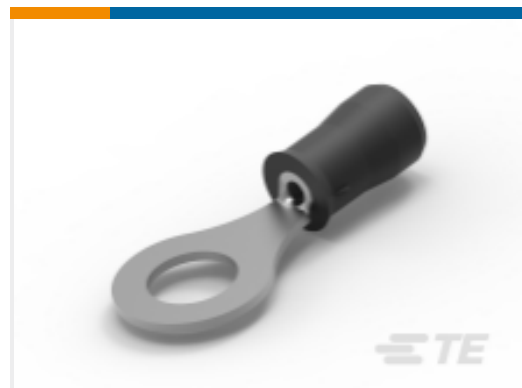
TE 产品编号35149 PIDG Ring Tongue Terminals