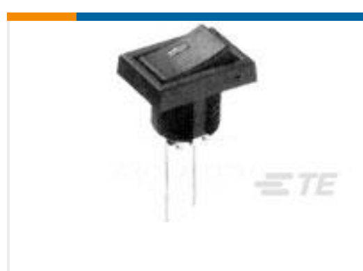
TE 产品编号1825420-1 TRD13D10WL04 rocker switch