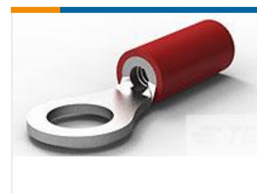
TE 产品编号32952 PG R 22-16 COMM 22-18 MIL 10