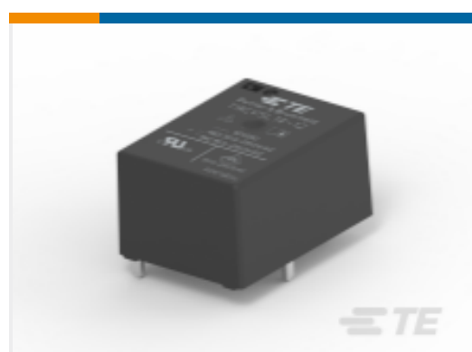
TE 产品编号1558666-1 T9GS1L14-5