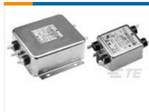
TE 产品编号6609042-1 3VS1=F7246 S0