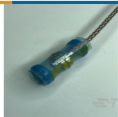
TE 产品编号852625-000 SO63-1-9036-22