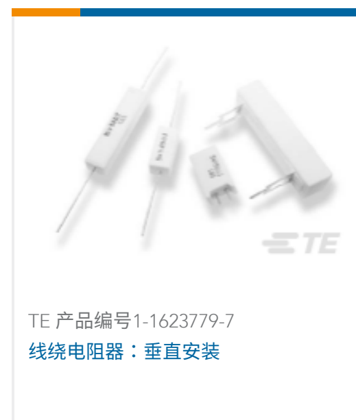
TE 产品编号1-1623779-7 线绕电阻器: 垂直安装