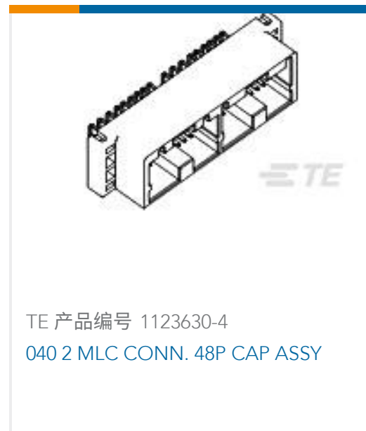
TE 产品编号 1123630-4 040 2 MLC CONN. 48P CAP ASSY