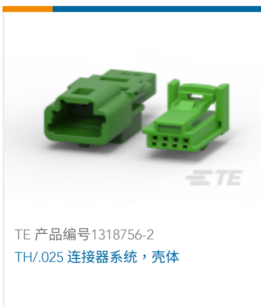
TE 产品编号1318756-2 TH/.025 连接器系统, 壳体