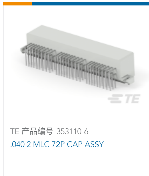
TE 产品编号 353110-6 .040 2 MLC 72P CAP ASSY