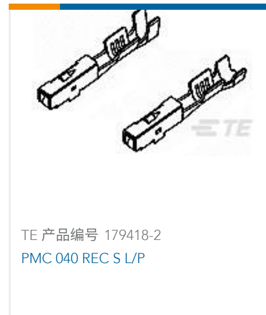
TE 产品编号 179418-2 PMC 040 REC S L/P