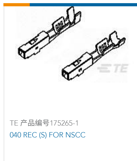
TE 产品编号175265-1 040 REC (S) FOR NSCC