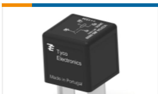
TE 产品编号1-1393302-4 VF711H11/X839