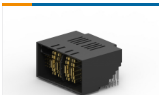
TE 产品编号2204440-1 MULTI-BEAM HD R/A PLUG 15S+2P+2P+15S