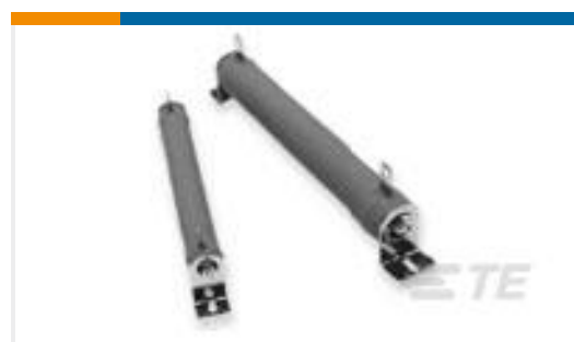
TE 产品编号2-1879457-3 TE 2500W 68R 5% Bracket