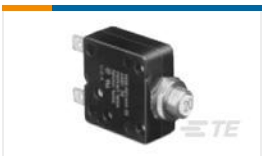
TE 产品编号1-1393249-6 W58-XB1A4A-30=W58