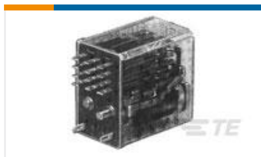
TE 产品编号2-1393766-5 R10-E1X6-115V=R10