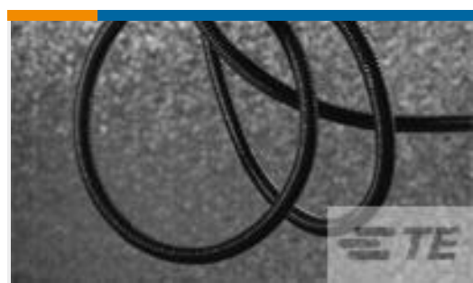
TE 产品编号7730454002 HCTE-1250-0-SP