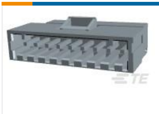
TE 产品编号3-641438-9 09P MTA156 PSTD CONN ASSY WHT