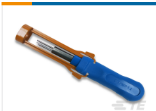
TE 产品编号3-1579007-1 EXTRATION TOOL