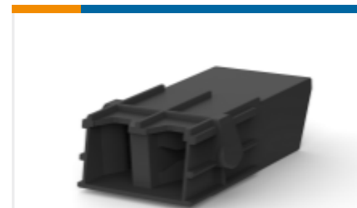
TE 产品编号1969726-1 2P HEAVY DUTY BURNER HSG