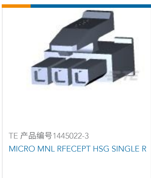
TE 产品编号1445022-3 MICRO MNL RFECEPT HSG SINGLE R