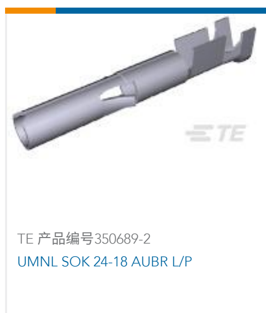
TE 产品编号350689-2 UMNL SOK 24-18 AUBR L/P