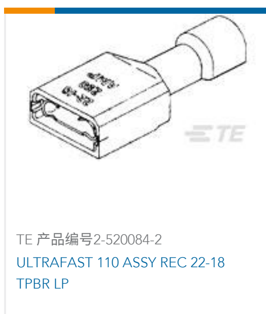
TE 产品编号2-520084-2 ULTRAFast 110 ASSY REC 22-18 TPBR LP