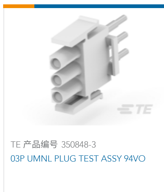
TE 产品编号 350848-3 03P UMNL PLUG TEST ASSY 94VO