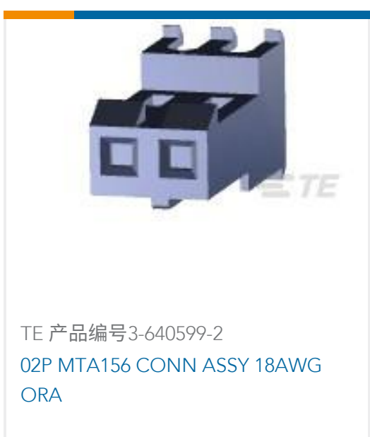
TE 产品编号3-640599-2 02P MTA156 CONN ASSY 18AWG ORA