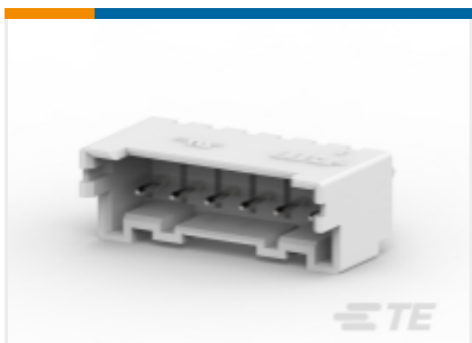
TE 产品编号1969730-6 EP2.5 SHROUDED HDR ASSY 6P VERTICAL