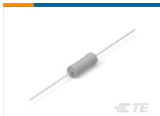
TE 产品编号4-1623720-0 CCR2 6R8 10% TAPED