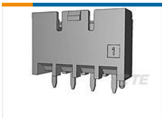
TE 产品编号1-1376385-2 5mm B-T-W Conn. 6P HDR ASSEMBL