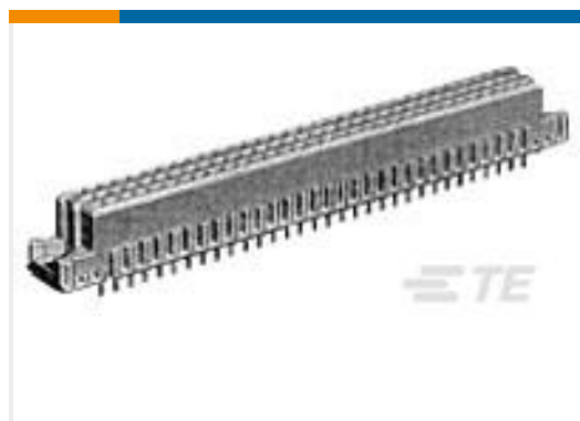
TE 产品编号5650963-5 ASSY, RECEPTACLE, EUROCARD, TYPE