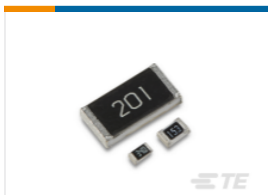
TE 产品编号6-2176330-1 CRGP 2010 1M0 1%