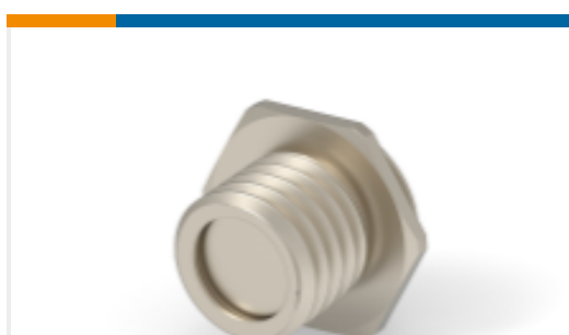
TE 产品编号254737-E M12 METAL SHELL, MALE, VERT, 9MM, D8.35