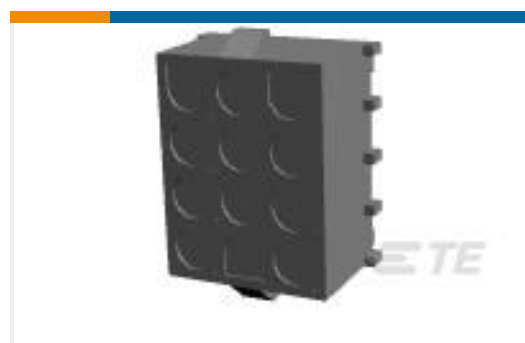
TE 产品编号350829-4 12P UMNL HDR ASSY PC 94VO LF