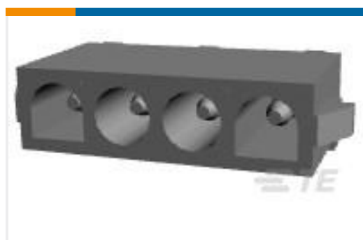
TE 产品编号350792-3 04P UMNL PIN HDR ASSY 94VO LF