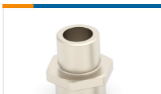
TE 产品编号394863-E M12 METAL SHELL, MALE, VERT, 13MM, D9.55