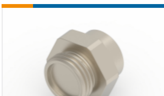
TE 产品编号254154-E M8 METAL SHELL, FEMALE, VERT, 9MM