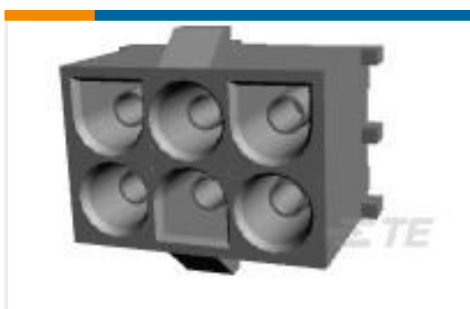
TE 产品编号350827-4 06P UMNL HDR ASSY PC 94VO LF