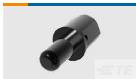
TE 产品编号1766274-1 CONTACT,PIN,#0