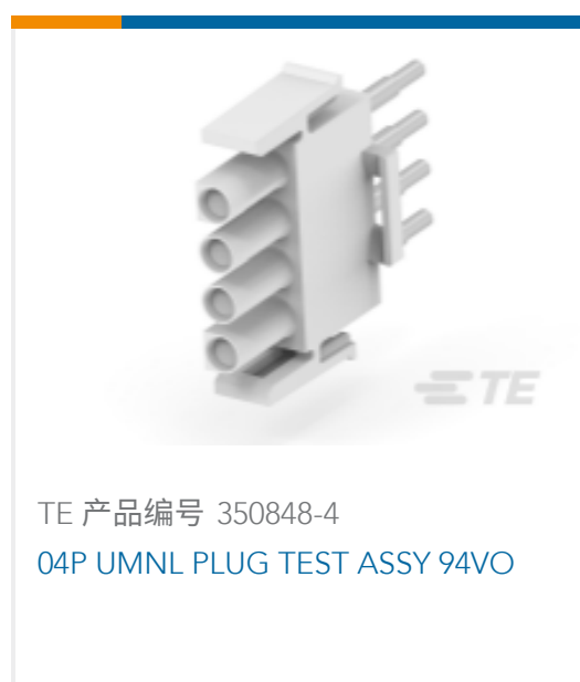
TE 产品编号 350848-4 04P UMNL PLUG TEST ASSY 94VO