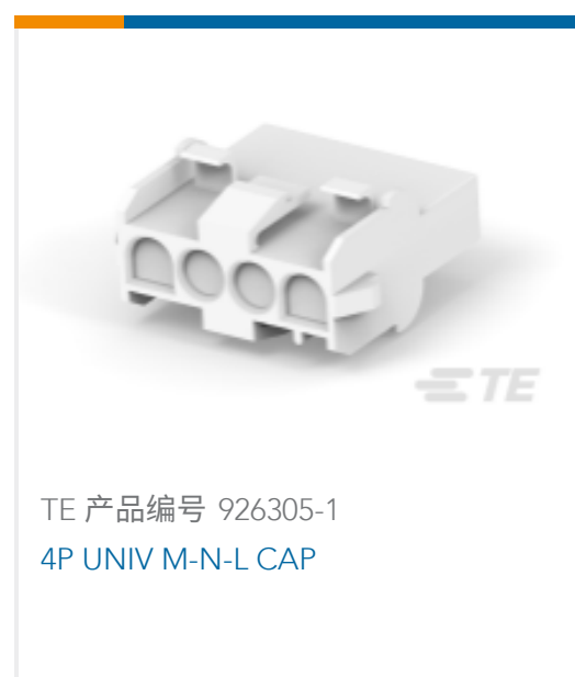
TE 产品编号 926305-1 4P UNIV M-N-L CAP