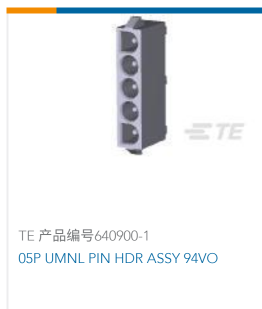
TE 产品编号 640900-1 05P UMNL PIN HDR ASSY 94VO