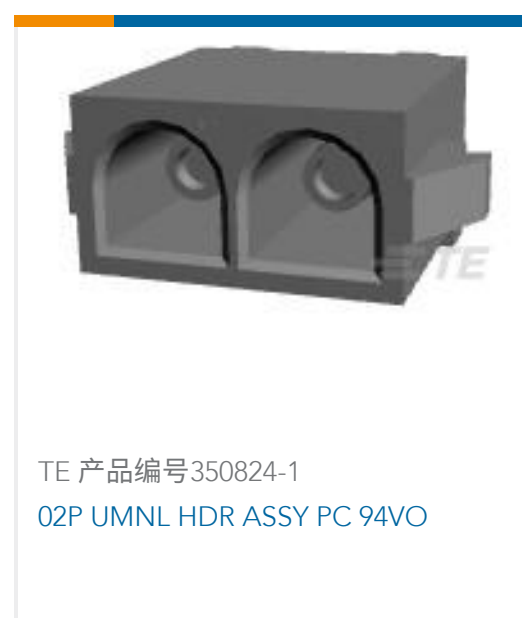
TE 产品编号 350824-1 02P UMNL HDR ASSY PC 94VO