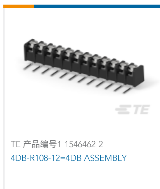
TE 产品编号 1-1546462-2 4DB-R108-12=4DB ASSEMBLY