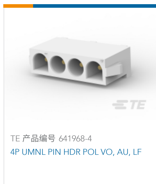
TE 产品编号 641968-4 4P UMNL PIN HDR POL VO, AU, LF