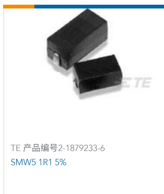
TE 产品编号 2-1879233-6 SMW5 1R1 5%