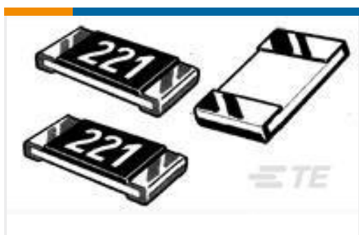
TE 产品编号3-2176231-9 3522 390R 1% 3W