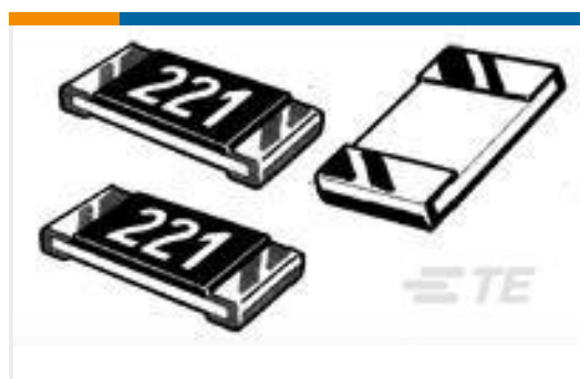
TE 产品编号2176071-5 3521 200K 1% 2W