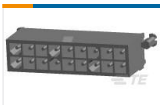
TE 产品编号1-794076-0 18P MINI UMNL HDR W/O DH SN LF