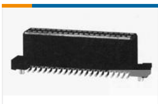
TE 产品编号5-104550-9 100 SYS50 SURFMNT DRST RCPT SN