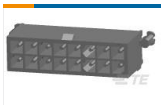
TE 产品编号1-794075-0 16P MINI UMNL HDR W/O DH SN