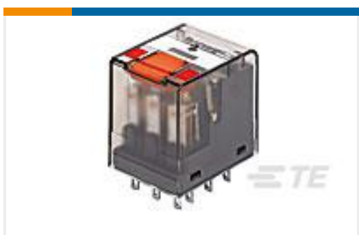
TE 产品编号8-1419132-9 PT580615