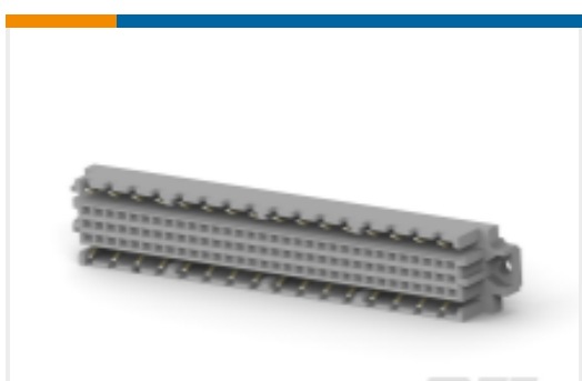
TE 产品编号5650992-5 ASSY,RECPT,ENH.TYPE C, EUROCARD,L-FREE,5