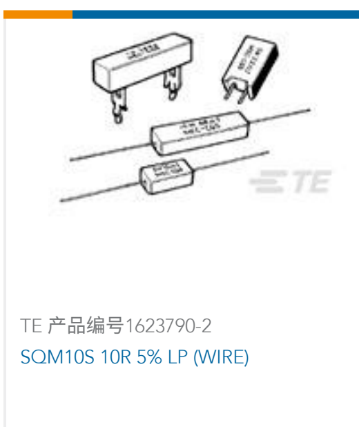
TE 产品编号1623790-2 SQM10S 10R 5% LP (WIRE)