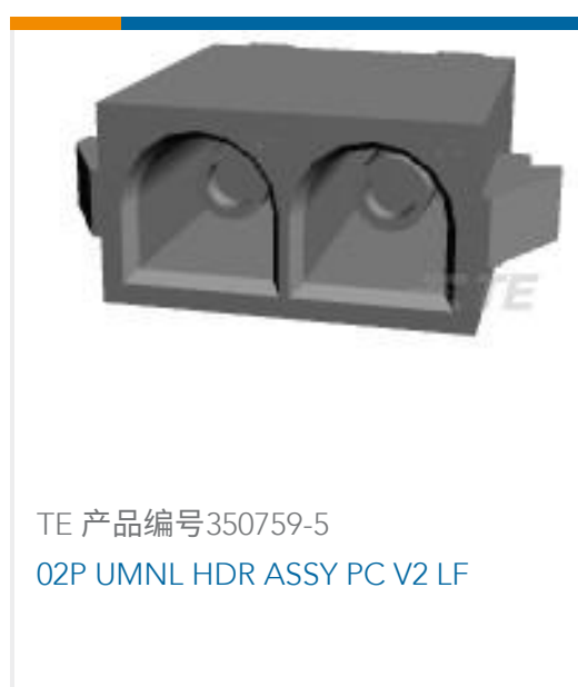
TE 产品编号350759-5 02P UMNL HDR ASSY PC V2 LF