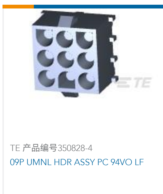
TE 产品编号350828-4 09P UMNL HDR ASSY PC 94VO LF