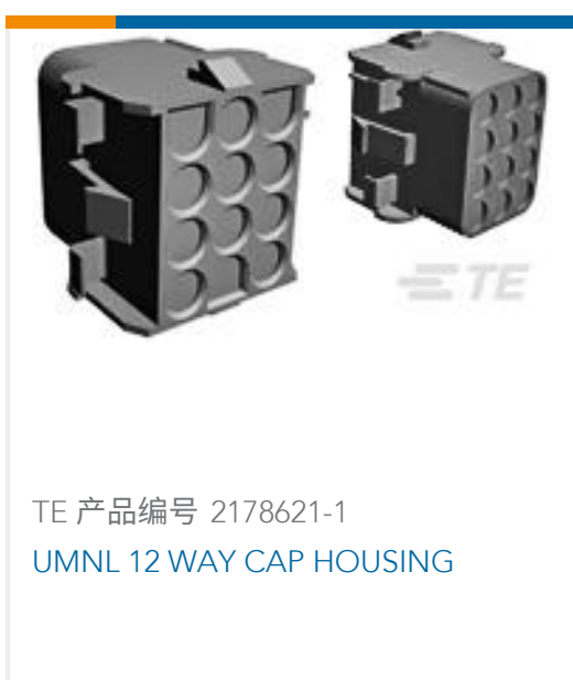
TE 产品编号 2178621-1 UMNL 12 WAY CAP HOUSING