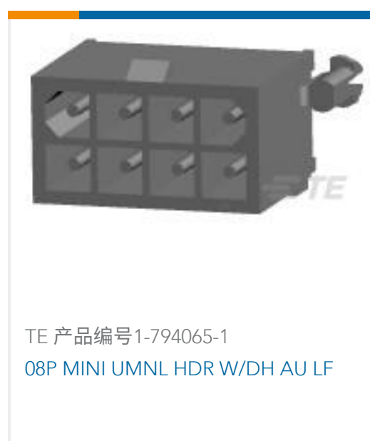
TE 产品编号1-794065-1 08P MINI UMNL HDR W/DH AU LF