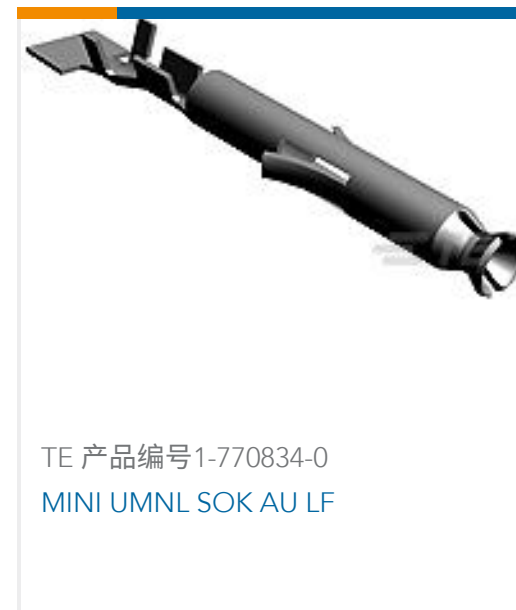
TE 产品编号1-770834-0 MINI UMNL SOK AU LF