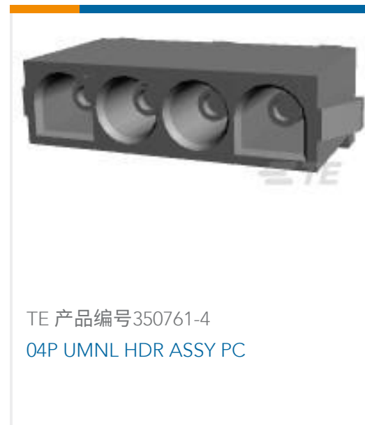
TE 产品编号350761-4 04P UMNL HDR ASSY PC