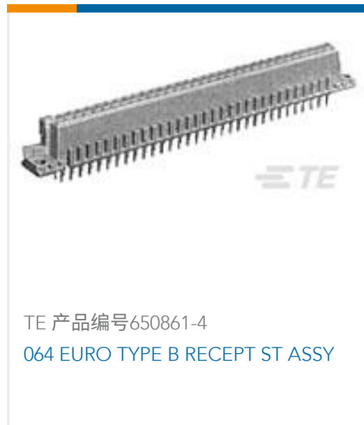
TE 产品编号650861-4 064 EURO TYPE B RECEPT ST ASSY