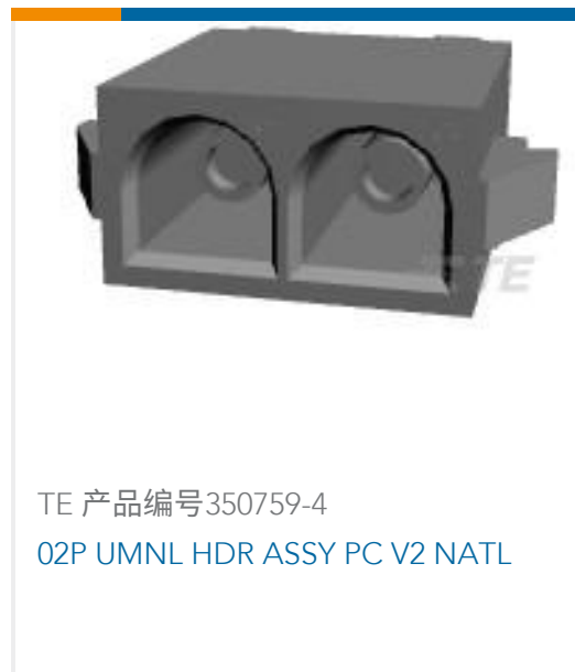
TE 产品编号350759-4 02P UMNL HDR ASSY PC V2 NATL