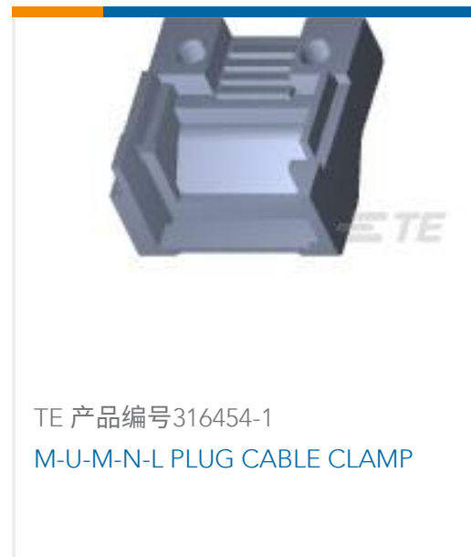
TE 产品编号316454-1 M-U-M-N-L PLUG CABLE CLAMP