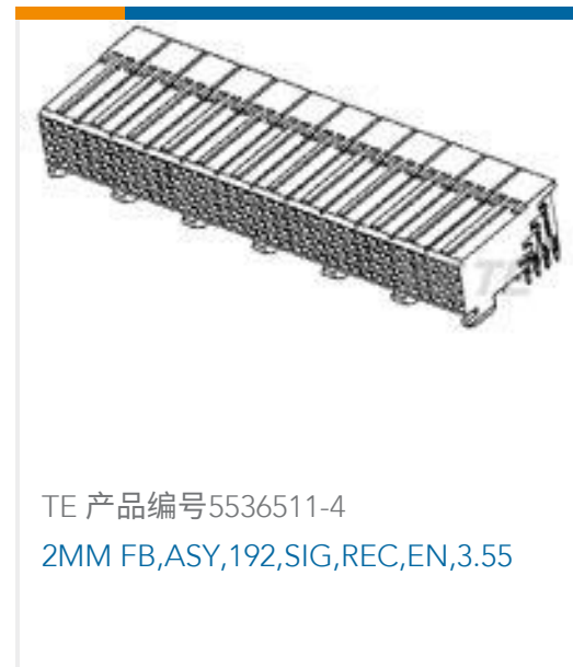
TE 产品编号5536511-4 2MM FB,ASY,192,SIG,REC,EN,3.55