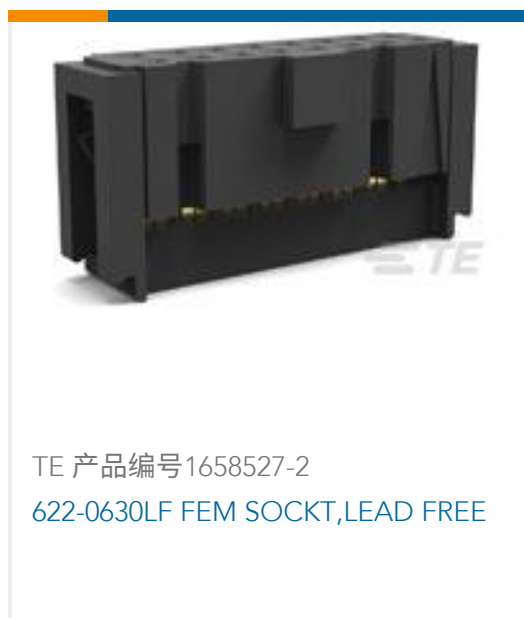
TE 产品编号1658527-2 622-0630LF FEM SOCKET,LEAD FREE