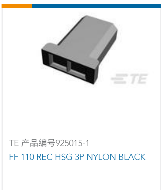
TE 产品编号925015-1 FF 110 REC HSG 3P NYLON BLACK