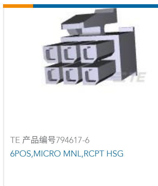
TE 产品编号794617-6 6POS,MICRO MNL,RCPT HSG