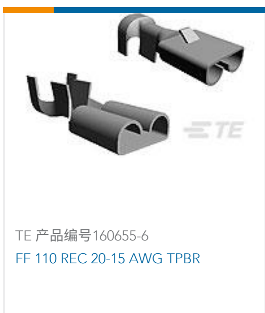
TE 产品编号160655-6 FF 110 REC 20-15 AWG TPBR