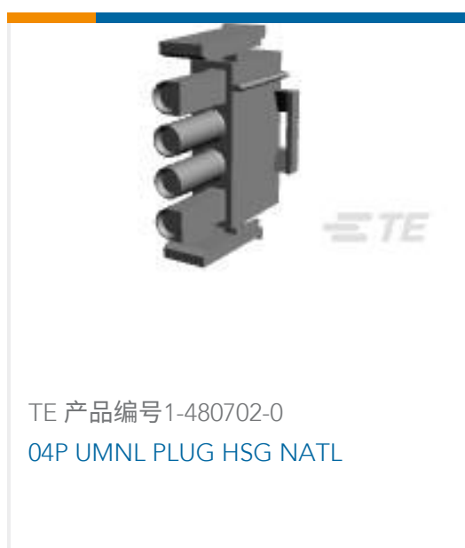
TE 产品编号1-480702-0 04P UMNL PLUG HSG NATL