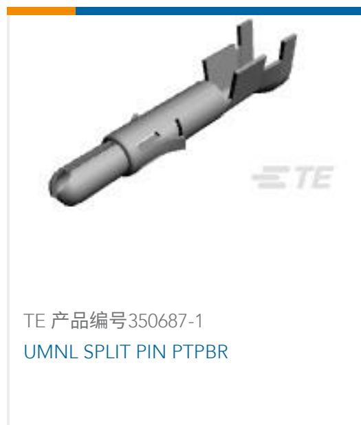
TE 产品编号350687-1 UMNL SPLIT PIN PTPBR