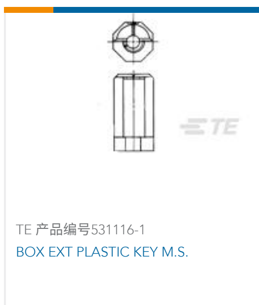
TE 产品编号531116-1 BOX EXT PLASTIC KEY M.S.