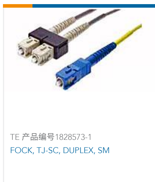
TE 产品编号1828573-1 FOCK, TJ-SC, DUPLEX, SM