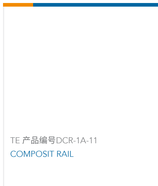
TE 产品编号DCR-1A-11 COMPOSIT RAIL