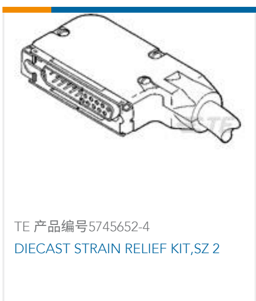
TE 产品编号5745652-4 DIECAST STRAIN RELIEF KIT, SZ 2