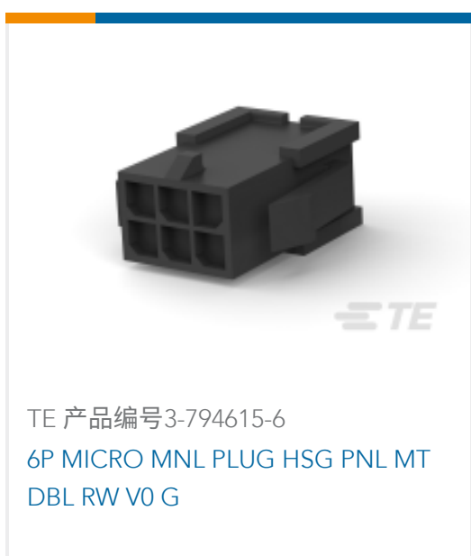
TE 产品编号3-794615-6 6P MICRO MNL PLUG HSG PNL MT DBL RW V0 G