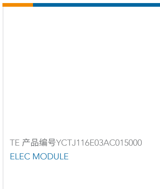
TE 产品编号YCTJ116E03AC015000 ELEC MODULE