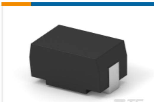
TE 产品编号1879234-8 SMD 功率电阻器：7 瓦特，200-2M 欧姆