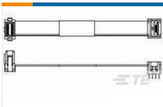
TE 产品编号2127216-1 TCA TO VARFLEX CABLE ASSEMBLY