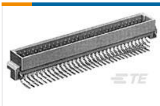
TE 产品编号5650947-5 ASSY,PIN,EUROCARD,TYPE C,LEAD-