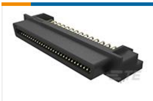
TE 产品编号3-5175474-6 CHAMP 050 B/B REC H W/LEG 50P