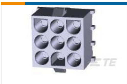
TE 产品编号350990-4 09P UMNL HDR ASSY LNG/TL