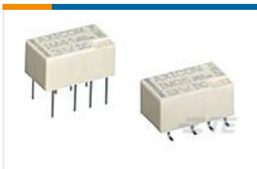
TE 产品编号6-1462037-2 IM44GR=IM RELAY 100mW 6V BIS