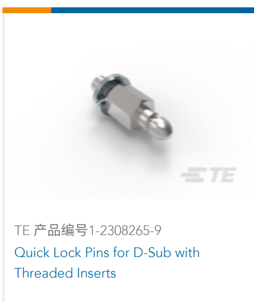
TE 产品编号1-2308265-9 Quick Lock Pins for D-Sub with Threaded Inserts