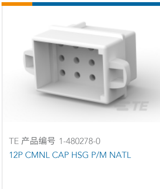
TE 产品编号 1-480278-0 12P CMNL CAP HSG P/M NATL