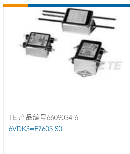
TE 产品编号6609034-6 6VDK3=F7605 S0