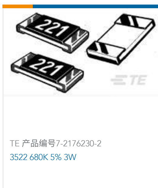
TE 产品编号7-2176230-2 3522 680K 5% 3W