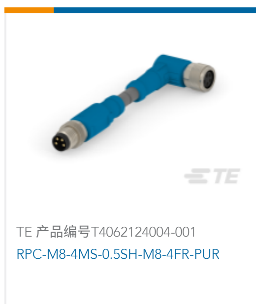
TE 产品编号T4062124004-001 RPC-M8-4MS-0.5SH-M8-4FR-PUR