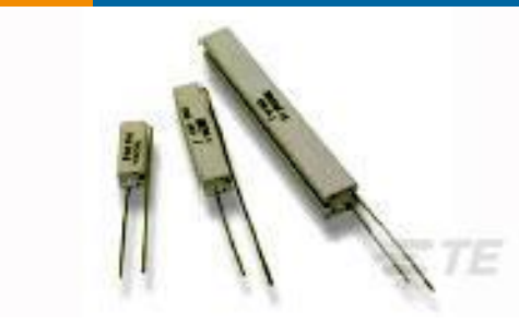
TE 产品编号1623722-4 SBCH 11 33R 5%