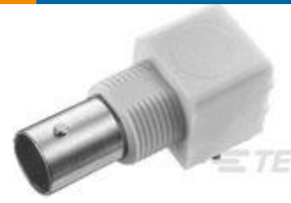
TE 产品编号5415633-1 RTANG BNC PCB JACK - 75 OHM