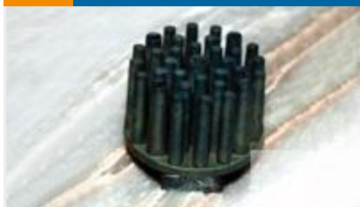
TE 产品编号1-1542001-2 HTS264NF-D=HS ASSY PPA CLIP