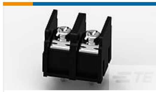
TE 产品编号1977477-2 Module Dual Barrier, .325 CL, 2 Pos.