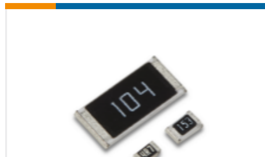
TE 产品编号1-2176341-4 CRGCQ 0805 120R 1%