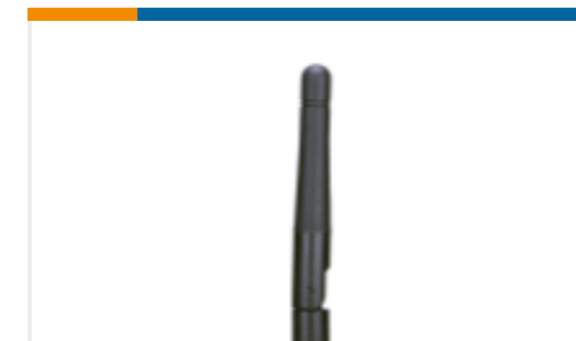
TE 产品编号ANT-DB1-LCD-RPS Antenna 2.4/5.8GHz Dipole Tilt Swivel RP