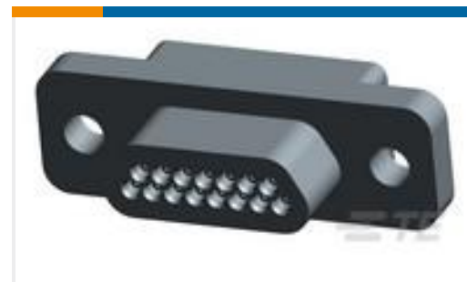
TE 产品编号1532180-3 M83513/03-B03N, MCKS-N1-B-15P6G9-18.0