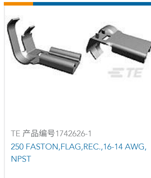
TE 产品编号1742626-1 250 FASTON, FLAG, REC., 16-14 AWG, NPST