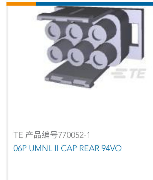
TE 产品编号770052-1 06P UMNL II CAP REAR 94VO