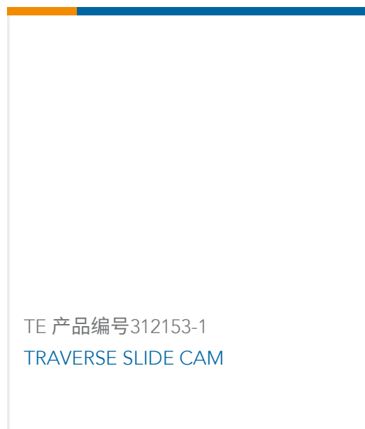
TE 产品编号312153-1 TRAVERSE SLIDE CAM