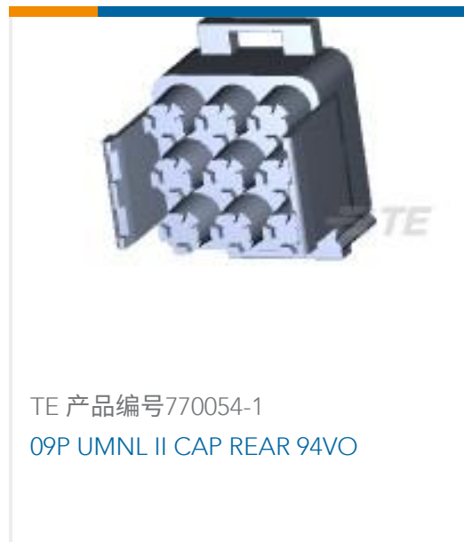
TE 产品编号770054-1 09P UMNL II CAP REAR 94VO