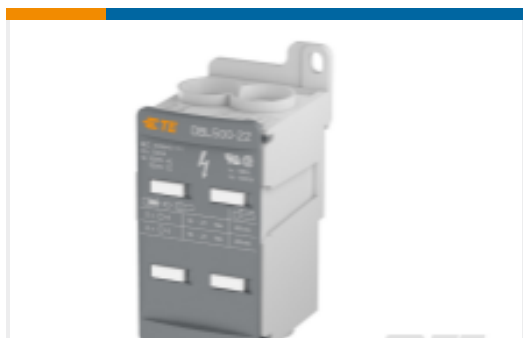
TE 产品编号1SNL850001R0000 DBL500-22