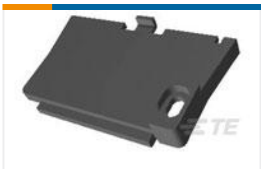
TE 产品编号643314-1 08P UMNL STR/REL