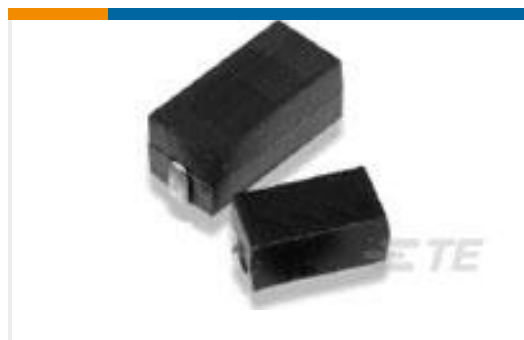
TE 产品编号3-1879022-9 SMF3 12K 5%