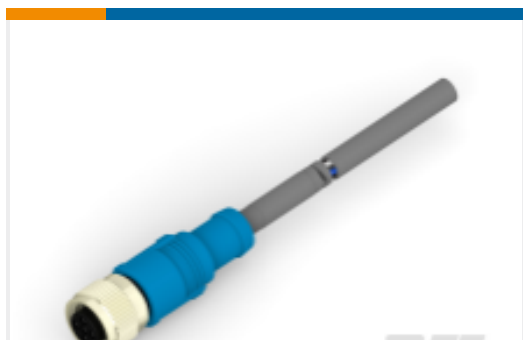
TE 产品编号T4161320004-002 RPC-M12-FS-4CON-PUR-1.0SH