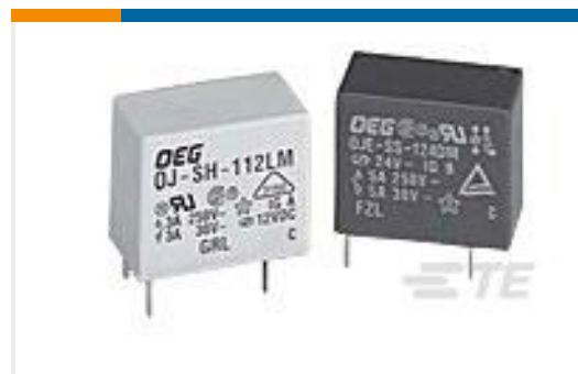
TE 产品编号1461014-2 OJ-SS-124LMHF,000