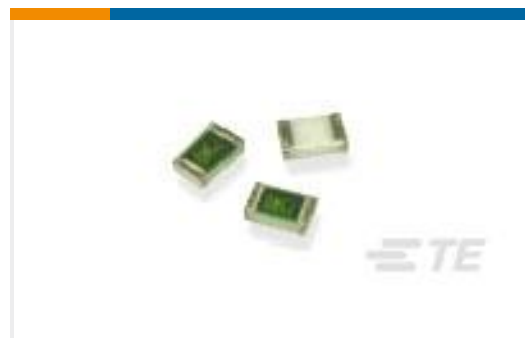
TE 产品编号4-2176093-4 RP 2A 0.25W 27K4 0.1% 25PPM 1K RL