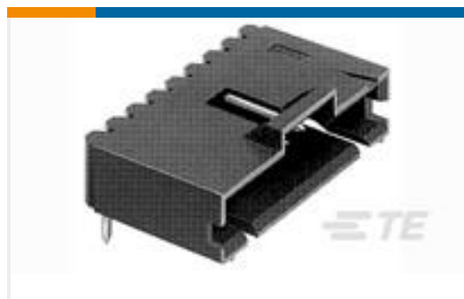
TE 产品编号6-103635-9 20 MTE HDR SRRA LTCH.100CL LF