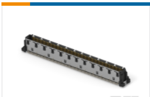
TE 产品编号2357798-3 16G,05FH,plug,220P 8H,T&R, W/ CAP