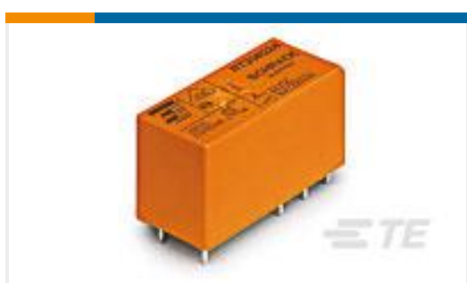
TE 产品编号2-1393238-4 RTB14524