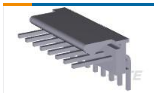
TE 产品编号640457-8 08P MTA100 HDR ASSY SQ R/A F/L