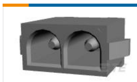
TE 产品编号350428-4 02P UMNL PIN HDR ASSY NATL AU