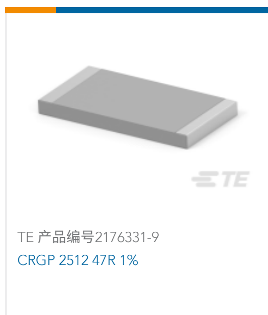
TE 产品编号2176331-9 CRGP 2512 47R 1%