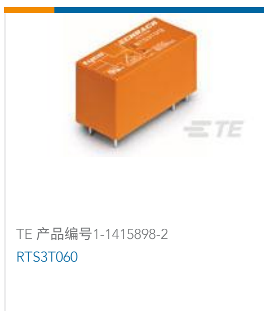
TE 产品编号1-1415898-2 RTS3T060