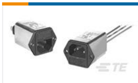
TE 产品编号1-6609115-2 3EGG1-2 S0=F7385D