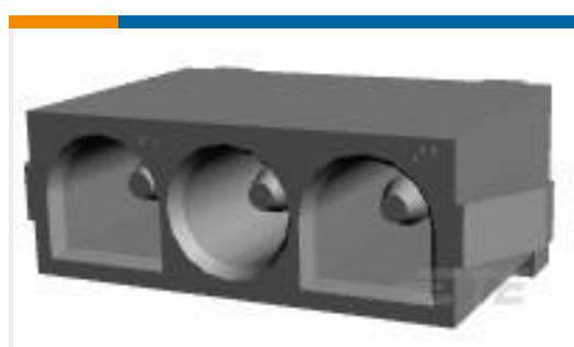
TE 产品编号350429-4 03P UMNL PIN HDR ASSY NATL LF