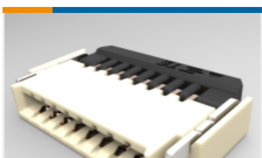
TE 产品编号2328702-4 4PIN 0.5MMP FPC CONNECTOR, BACK FLIP LOCK