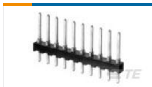
TE 产品编号87224-5 05 MODII HDR SRST UNSHRD .100