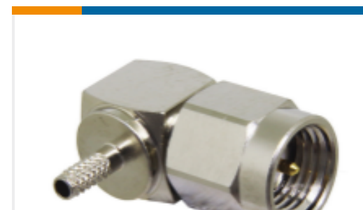
TE 产品编号CONSMA012-R178 SMA Plug 50 Ohm Cable Crimp