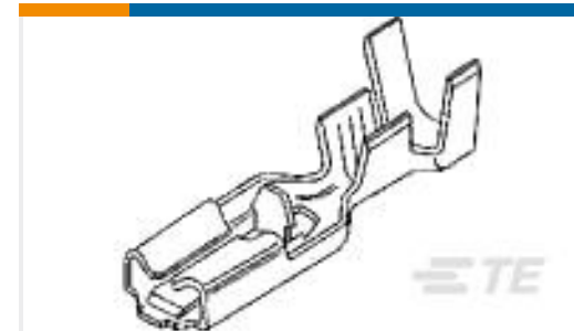
TE 产品编号63784-1 RCPT POS/LK 187 0126PTPBR