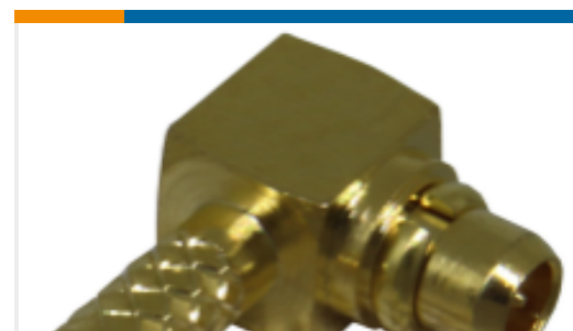
TE 产品编号CONMMCX012-R178 MMCX Jack 50 Ohm Cable Crimp