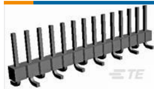
TE 产品编号5-146128-4 06 MODII HDR SR SFMNT B/A .100