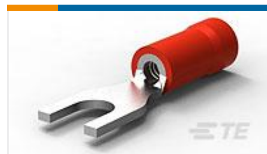
TE 产品编号171551-2 P.G SPADE