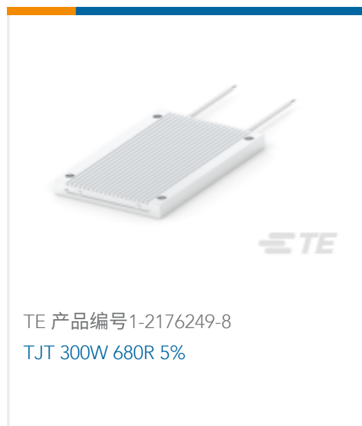
TE 产品编号1-2176249-8 TJT 300W 680R 5%