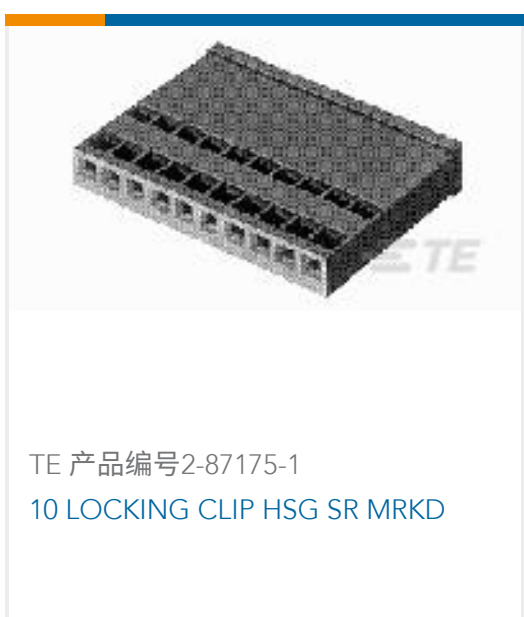
TE 产品编号2-87175-1 10 LOCKING CLIP HSG SR MRKD