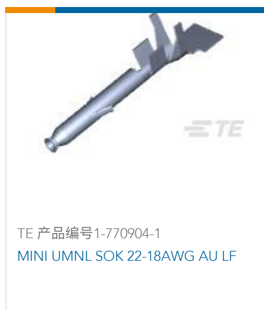
TE 产品编号1-770904-1 MINI UMNL SOK 22-18AWG AU LF