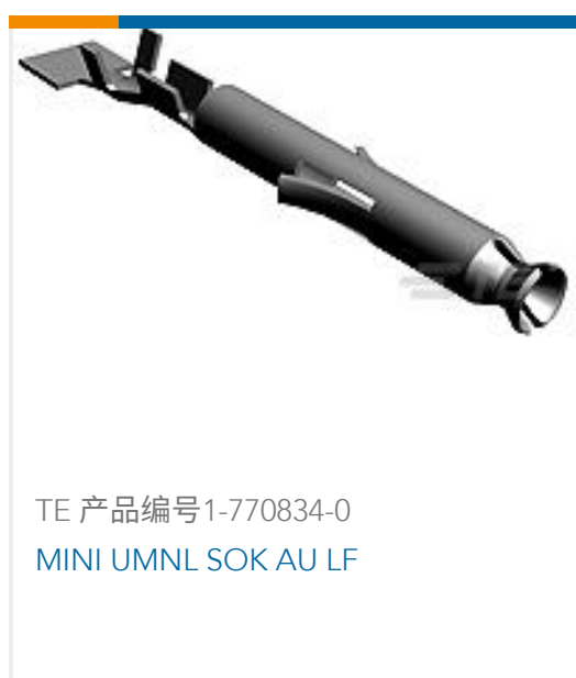
TE 产品编号1-770834-0 MINI UMNL SOK AU LF