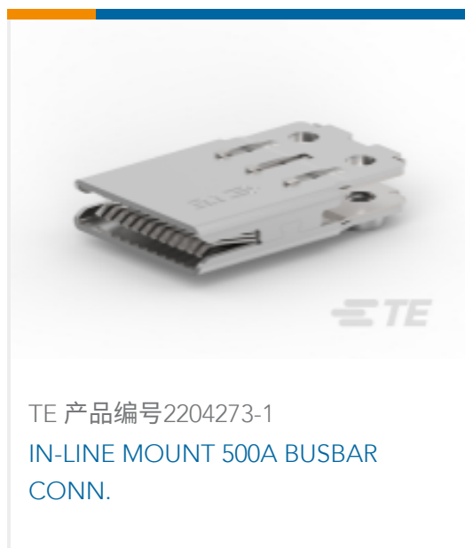
TE 产品编号2204273-1 IN-LINE MOUNT 500A BUSBAR CONN.