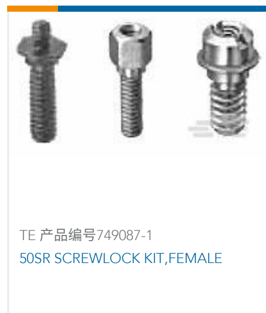
TE 产品编号749087-1 50SR SCREWLOCK KIT, FEMALE