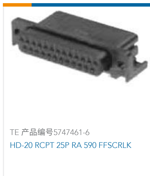
TE 产品编号5747461-6 HD-20 RCPT 25P RA 590 FFSCRLK