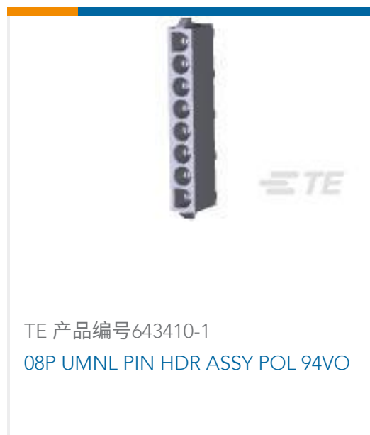
TE 产品编号643410-1 08P UMNL PIN HDR ASSY POL 94VO