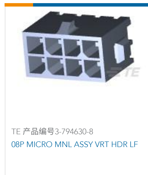
TE 产品编号3-794630-8 08P MICRO MNL ASSY VRT HDR LF