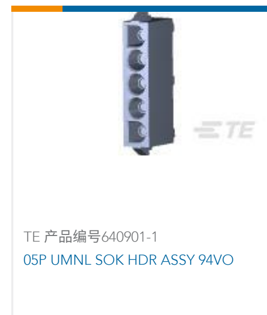
TE 产品编号640901-1 05P UMNL SOK HDR ASSY 94VO