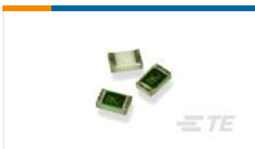
TE 产品编号6-1879337-3 CPF 0603 11K 1% 50PPM 1K RL