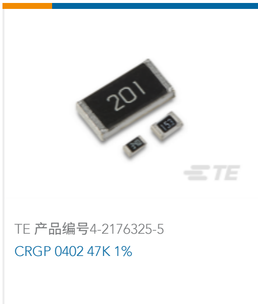
TE 产品编号4-2176325-5 CRGP 0402 47K 1%