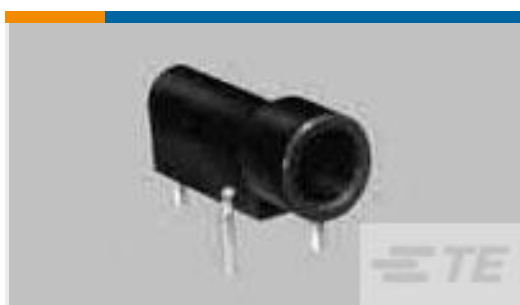
TE 产品编号350180-2 TEST PROBE REC130L SPCL RED GPBR