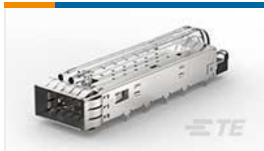
TE 产品编号2170773-1 CAGE ASSY, QSFP28 1X1, SPRING, LP