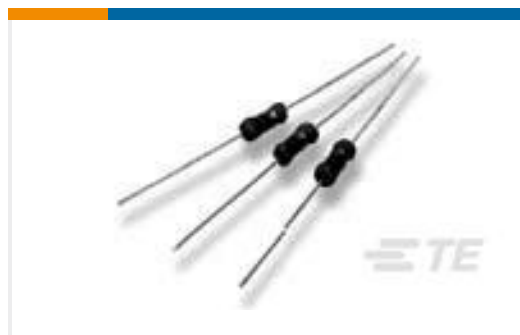
TE 产品编号9-1879352-9 RR02 5% 3K9 AMMO