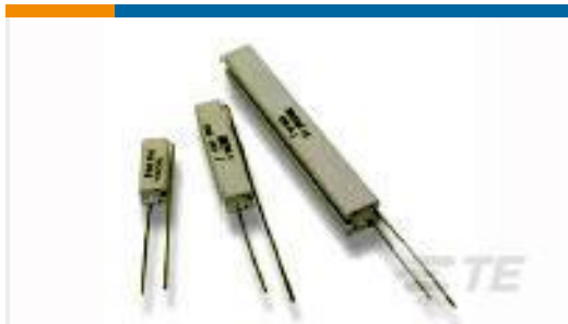
TE 产品编号2-1623730-1 BCHE SBICHE 4.4R7 5%