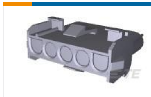
TE 产品编号480764-2 05P UMNL CAP HSG RED