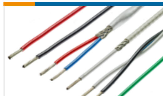
TE 产品编号CT75843001 44A1321-14-0/9-9