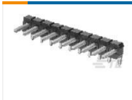
TE 产品编号 1-103148-6 16 MODII HDR SRRA B/A .100CL