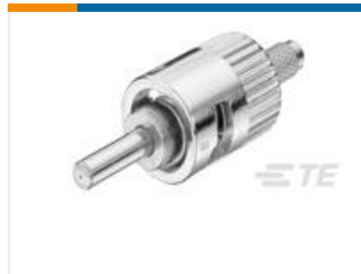
TE 产品编号 1-5504008-3 CONN KIT ,STC, 240 um, MM, 3 mm