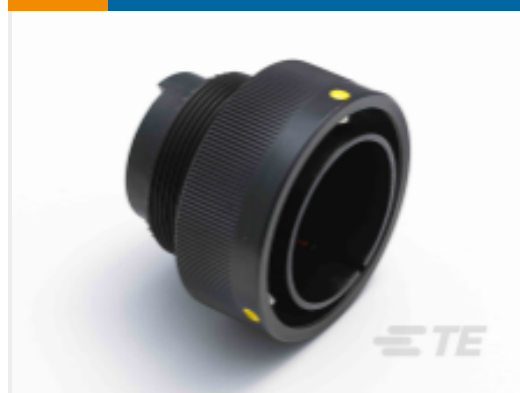
TE 产品编号 Y5015-000000008791 FREE PIN CONNECTOR