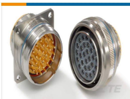
TE 产品编号ZPF000000000008542 983-6S 10-05 S7