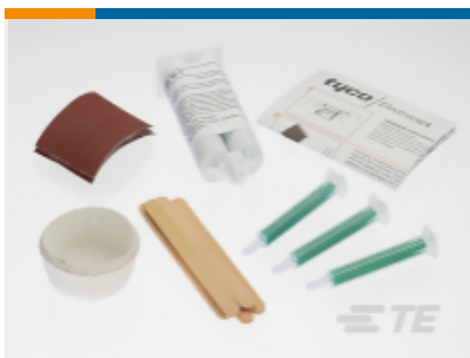
TE 产品编号 657863-000 S1125-KIT-8