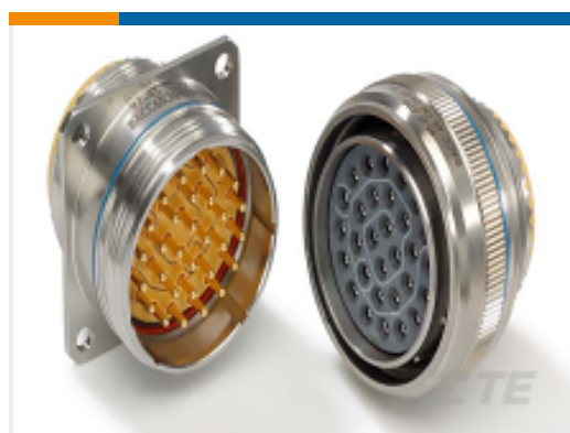
TE 产品编号ZPF000000000008703 983-6SE 08-03 P8