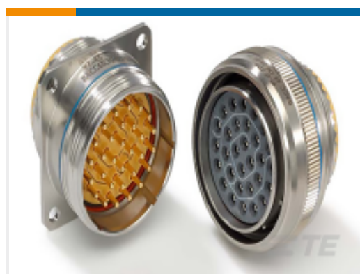
TE 产品编号ZPF000000000008962 983-6SE 20-39 P6