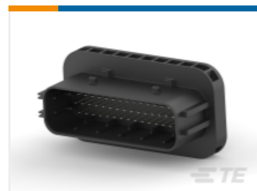
TE 产品编号1-2331102-1 TAB HEADER 46POS.