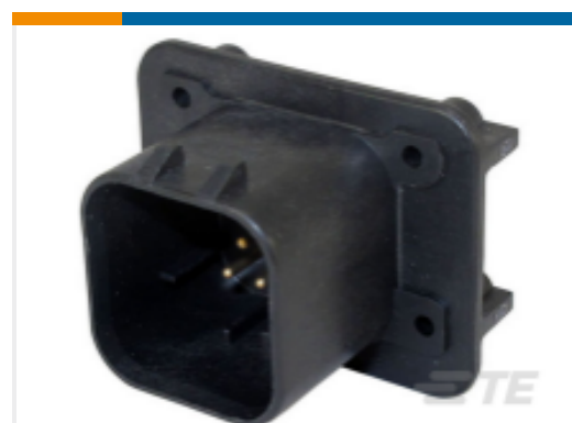
TE 产品编号1-776279-1 8POS,PIN DIA 1.3,HDR ASSY,90DEG, COD 1