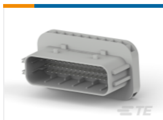
TE 产品编号2-2331102-1 TAB HEADER 46POS.