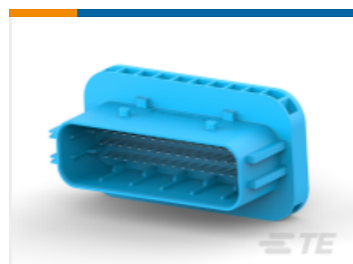
TE 产品编号3-2331102-1 TAB HEADER 46POS.