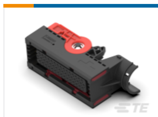
TE 产品编号3-2112231-1 46POS,AMP MCP1.5K,REC HSG,ASSY