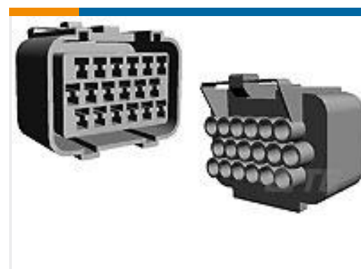
TE 产品编号344106-1 18W EMS.REC.HSG.ASSY.