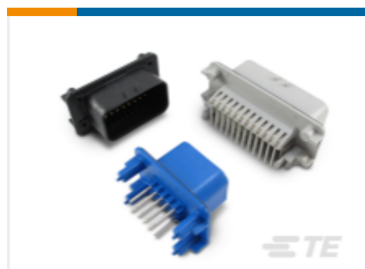
TE 产品编号1-776200-1 AMPSEAL PCB 接头