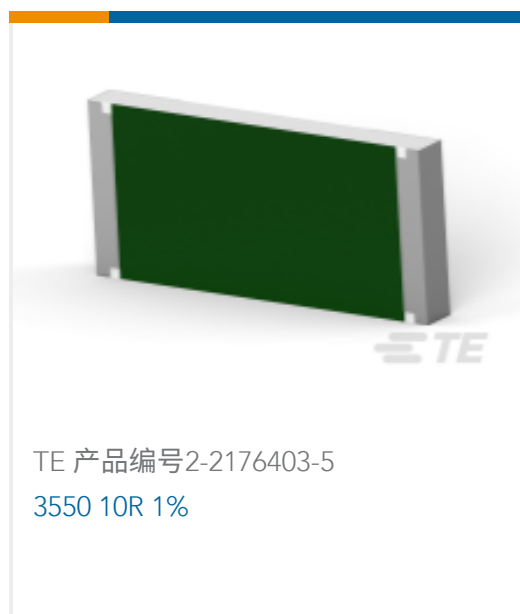
TE 产品编号2-2176403-5 3550 10R 1%