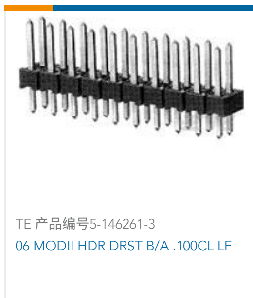
TE 产品编号5-146261-3 06 MODII HDR DRST B/A .100CL LF