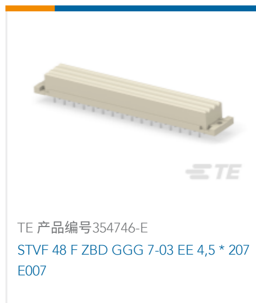
TE 产品编号354746-E STVF 48 F ZBD GGG 7-03 EE 4,5 * 207 E007