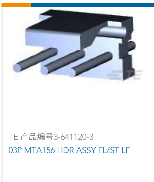
TE 产品编号3-641120-3 03P MTA156 HDR ASSY FL/ST LF