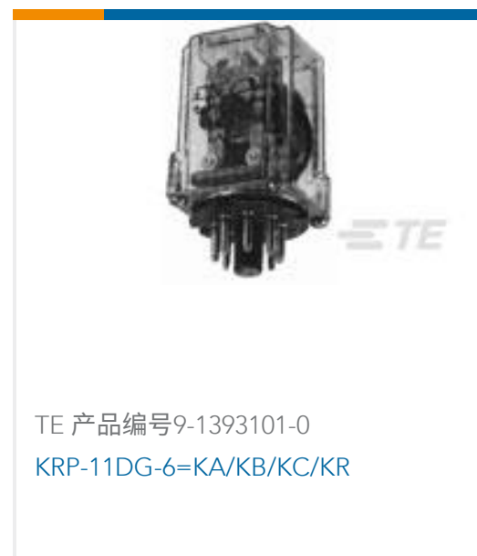
TE 产品编号9-1393101-0 KRP-11DG-6=KA/KB/KC/KR