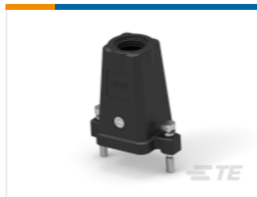
TE 产品编号T1926030116-009 H3APR-TGC-M16-EMC-C