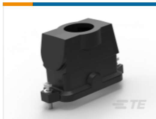
TE 产品编号T1922160140-000 H16BPR-TGHC-M40