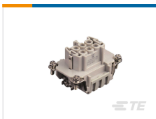
TE 产品编号T2040064201-000 HE-006-FC