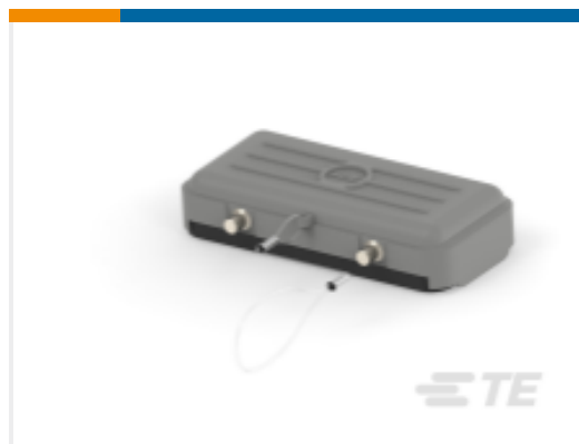
TE 产品编号T1010161600-000 H16B-KDTP-BO