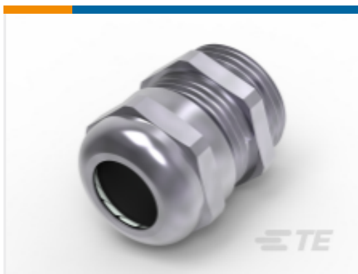
TE 产品编号T3609200102-000 DLX-20-M