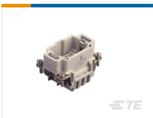
TE 产品编号T2040064101-000 HE-006-MC